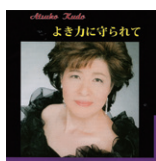
よき力に守られて 定価 2,500 円 (税込)

ボンヘッファーの「よき力に守られて」を中心に、「あなたに」「神の恵み」「詩篇 23 篇」「あぁ感謝せん」など 14 曲。