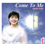
Come To Me 定価 3,000 円 (税込)

「きみは愛されるため生まれました」「とこしえに真実なお方」「救い主イエスと」「なんて美しい都(ゴスペル)」などライブ録音 14 曲。