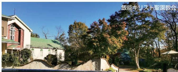
飯能キリスト聖園教会

礼拝では、ご高齢の方々も、皆さん大きな声で、歌詞の一つ一つの意味をかみしめながら心を込めて歌われます。美しい緑の山間に立てられた白いチャペル。そこには多くの人が集まり、教会の内外に賛美が溢れ流れています。