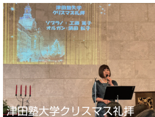
津田塾大学クリスマス礼拝

いつもAKWMのためにお祈りお支えくださり、心からのお礼を申し上げます。皆様のお祈りに支えられ、今年の全ての奉仕を感謝のうちに終えることができました。救いの決心をされた方、心を開かれた方々が、教会に繋がり、信仰が確立されて、主の御手のうちに守られ成長してゆきますようお祈りください。