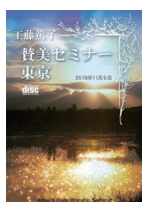
賛美セミナーI CD 4枚組

2013年11月4日大阪セミナー録画 (テキスト付) 定価 4,000円(税込)