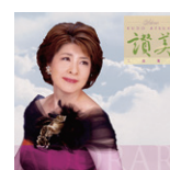
讚美 Adorar 定価 1,500 円 (税込)

「鹿のように」「安けさは川のごとく」「Via Dolorosa」「輝く日を仰ぐとき」「カドシュ」「いちわのすずめ」「アメイジング・グレイス」など 18 曲。