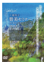
賛美セミナーII DVD 2枚組

2015年11月7日大阪セミナー録画 (テキスト付) 定価 4,000円(税込)