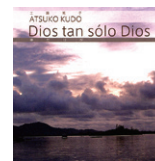
神だけが Dios tan solo Dios 定価 2,500 円 (税込)

ボンヘッファーの「よき力に守られて」を中心に、「あなたに」「神の恵み」「詩篇 23 篇」「あぁ感謝せん」など 14 曲。