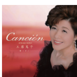
カンシオン Canción 定価 2,500 円 (税込)

「安けさは川のごとく」「赤とんぼ」「荒城の月」「黄金のエルサレム」「私を平和の道具としてください」などライブ録音 12 曲。