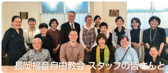
長岡福音自由教会 スタッフの皆さんと