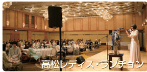
高松レディス・ランチオン

5月21日の高松レディス・ランチオン、5月25日の長岡福音自由教会のコンサートを主の導きの中で終えることができました。皆様のお祈りのお支えに心から感謝いたします。それぞれ、信仰の決心をされた方、イエス様に心を開かれた方が数名おられました。どうぞその方々がしっかり教会に繋がりますようお願いください。