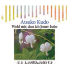
主よ人の望みの喜びよ 定価 1,500円(税込)

「主よ人の望みの喜びよ」「マタイ受難曲アリア」「メサイヤ・アリア」「キリストにはかえられません」「アメイジング・グレイス」「主の祈り」など、たましいの歌 12曲。