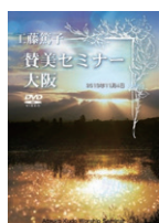
賛美セミナー I DVD 2 枚組

2013年11月4日大阪セミナー録画 (テキスト付) 定価 4,000円(税込)