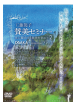
賛美セミナー II DVD 2 枚組

2015年11月7日大阪セミナー録画 (テキスト付) 定価 4,000円(税込)