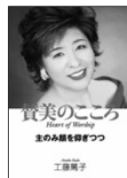
著者:工藤 篤子 出版社:イグレーブ 定価:1,575円(税込)