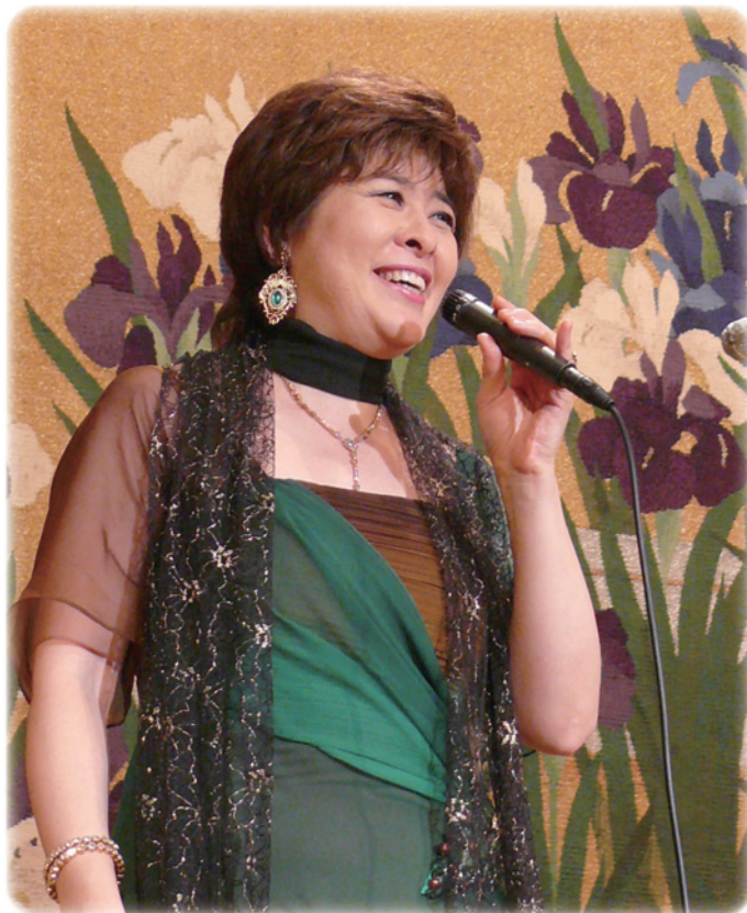
2010年10月5日大阪レディスランチョン

私はこの書簡から、まるで自分がパウロから励ましを受けるテモテのように、その福音の素晴らしさに心燃やされ、奮い立たされ、同時に、ミニストリーズのあるべき地点を再確認させ