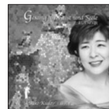
たましいの歌 定価3,000円(税込)