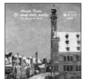
鳥のうた 定価2,500円(税込)