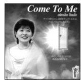
Come To Me 定価3,000円(税込)