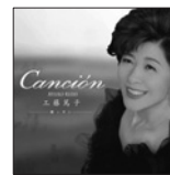
カンシオン 定価2,500円(税込)