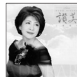
賛美 Adorar 定価1,200円(税込)