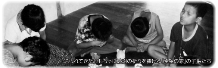
送られてきたおもちゃに感謝の祈りを捧げる「希望の家」の子供たち

いました。けれども、今も自分たちの家がなく、子供とスタッフ20人は借家に住んでいます。実は、数年前に土地を購入しました。M宣教師も建築資金を呼びかけ、捧げられた献金でフェンスを廻らし、トイレつを建てるのが出来ました。しかしそこで資金は尽き、工事はストップしてしまいました。時々与えられる資金で少しずつ工事を進めるのは適さないと判断し、建築実現の時を神様に委ねて待ちました。