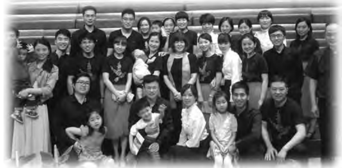
崇一堂「若者賛美チーム」の皆さんと

また、5年前の5周年記念聖会でのことですが、通訳者と私を車で送迎してくださった兄弟がいました。彼は、信仰を持ってからまだ2、3年しか経っていませんでしたが、みことばの霊的洞察においても、謙遜に仕える姿勢においても、26年も信仰者として生きてきた私が大いに学ばされるものがありました。その兄弟が、聖会の最終日、私たちをレストランに招待してくださいました。経済的に豊かではない彼の境遇を知っていた通訳者が支払いをしようとした時、彼は、「私から神の恵みを奪わないでください。」と言って、通訳者の支払いの申し出を断固として断ったのです。「与えることができるのは神の恵みです」。それが、心から出た言葉であることを私たちは実感し、彼のインビテーションを感謝してお受けしました。今年、崇一堂を訪れた時、彼は教会の数少ない長老のひとつに選ばれ、今までにも増して教会に仕えていました。彼らの喜んで仕える姿勢は、聖霊に満たされることによってのみ与えられるものなのだと確信しています。