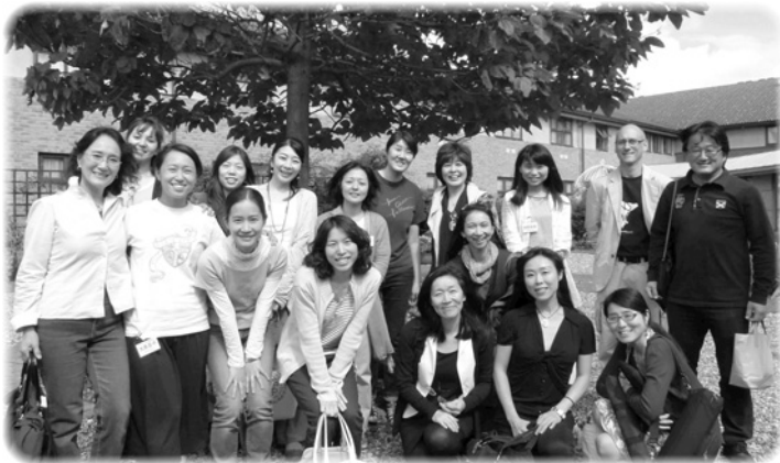
賛美チームの兄弟姉妹と

今回の大会は、「クリスチャンの生き方」の主題テーマのもと、各講師の先生方が、キリストに召された者としてのふさわしい生き方について、みことばから具体的に語っていただきました。折しも、ロンドンを中心に英国各地で暴動が勃発した時でした。人々のフラストレーションが小さなことをきっかけに突然爆発し、信じられないほど大きな暴動へと拡大したのです。私の住むドイツ同様、キリスト教国のひとつとされる英国ですが、「キリスト教的」ではもはや不十分であること、つまり、キリストの真理に立たなければ、キリストのいのちに生かされなければ、国も人も正しい道を歩むことができないことを痛感しました。この時代、欧州に生きる私たちが耳を傾け、目を留めなければならない大切なメッセージが語られた有意義な大会でした。